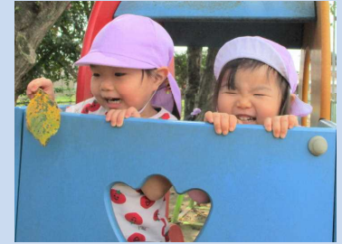
可愛いお顔がひょっこり！