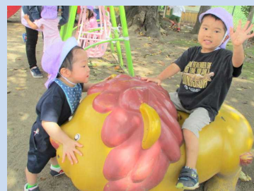
ライオンさんとも仲良し◎