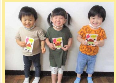
じいじ、ばあばに届いたかな？