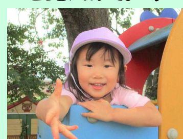
こっちにおいでよ～♪