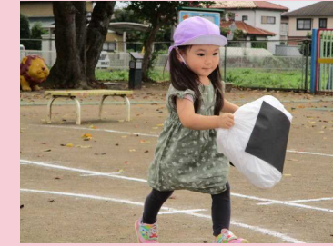
おいしいお弁当作るぞー！