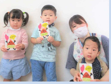
可愛い栗の出来上がり♪