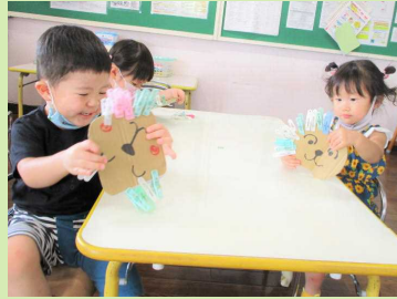
こんなにくっついたよ♪