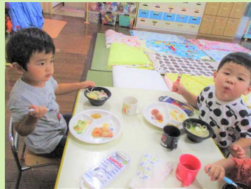
お月見うどん、美味しかったね♡