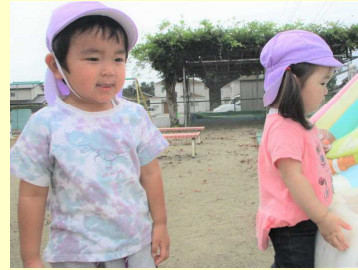
久しぶりのお外遊び、嬉しいな♪