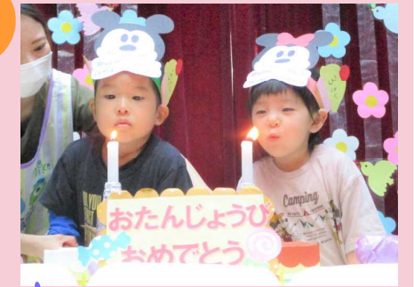
おたんじょうび おめでとう 仲良く一緒に、フウ～！！